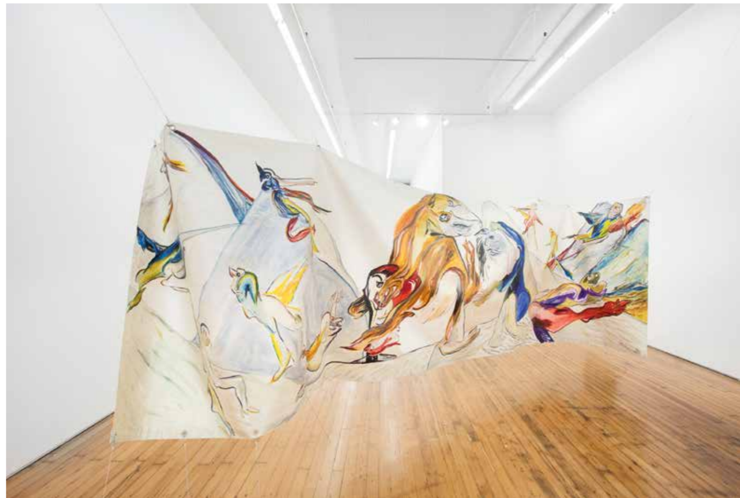
Jacqueline de Jong, The Backside of the Existence , 1992.

En 1973, J.G. Ballard publie Crash! , un roman qui met en scène la fascination de deux hommes pour les accidents de voiture et l'excitation sexuelle qu'ils leur procurent, les conduisant de fil en aiguille à les provoquer pour mieux en jouir. Les «infinies variations» destructrices des accidents et le «délire érotique 8 » qu'elles permettent, Jacqueline de Jong en sait quelque chose. En 1965 déjà, elle peignait Celle qui préfère les voitures au sein d'une série intitulée «Accidental Paintings». Une femme au visage rubicond, toute en dents et poitrine dénudée, manipule de ses doigts grossiers ce qui semble être une carcasse de voiture défoncée, dont émerge une main sanglante. Dans le roman de Ballard comme dans cette série, jantes et corps cabossés se resserrent sur un même plan chaotique, «dense et plat 9 ». Ce qui amuse l'artiste, c'est le drame à l'œuvre et ce que sa tension contenue peut générer comme modalités de représentation